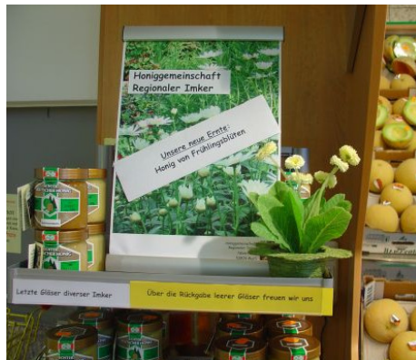
Ankündigung der neuen Ernte

Die Regale haben auf der Frontseite i.d.R. Einsteckleisten. In diesen können die Orte und Namen der Imker und die Honigbeschreibungen ausgewiesen werden. Der Kunde kann sich dann für den einen oder anderen Ort oder Imker in seiner Umgebung oder für eine Geschmacksbeschreibung entscheiden und dabei auch feststellen, dass die jeweiligen Honige stets unterschiedlich sind.