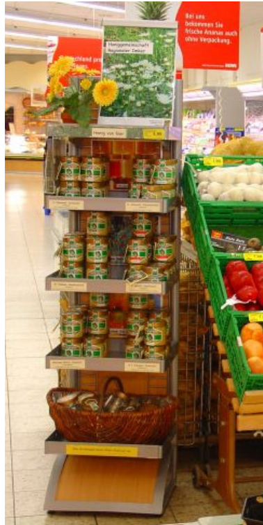
Das eigene Honigregal

Der Jahreszeit entsprechend ist eine wechselnde, dezente Dekoration hübsch anzusehen. Das Auge des Kunden sollte sich hin und wider über eine liebevoll gestaltete Abwechslung freuen. Eine Frau aus Ihrer Gemeinschaft wird schon etwas Passendes finden.