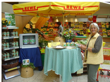
Honigverkostung im REWE-Markt Seelscheid

Die Degustation (Verkostung, Geschmacksbeschreibung) bringt dem Kunden die Geschmacksunterschiede zwischen den Honigen nahe. In der Regel ist die Degustation eine angekündigte Veranstaltung, bei der unter Anleitung eines Sachkundigen unterschiedliche Honige geschmacklich getestet, beschrieben und vorgestellt werden.