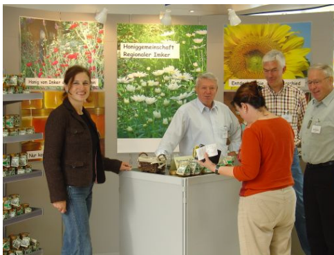
Auftaktpräsentation der Honiggemeinschaft Regionaler Imker Seelscheid und Umgebung

Als Profi werden Sie weder mit einem Tapetentisch noch mit einer Bierzeltgarnitur zu einer Präsentation ihrer Honiggemeinschaft gehen. Der Filialleiter schätzt und wünscht Professionalität. Ideal sind z.B. einfach aufzubauende Kleinmessestände von ca. 3 m Länge und 2,50 Höhe. Daran können Bilder über die Honiggemeinschaft im A0 oder A1 Format gut platziert werden.