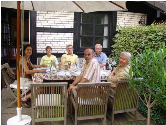
Informationstreffen zur Gründung der Regionalen Honiggemeinschaft Seelscheid und Umgebung.

Es ist wichtig, genügend interessierte Imker zu einer Informationsrunde einzuladen. Hier sollen die Idee, der Solidaritätsgedanke, die Honigqualität, die Aufmachung der Gläser, Teilnahmebedingungen, das Finanzielle und die Aufgabenteilung besprochen werden.