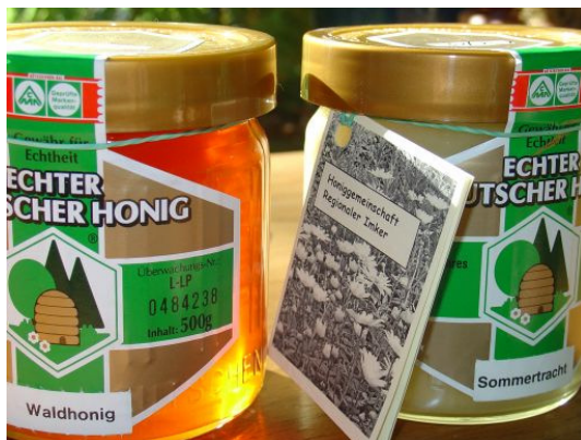
Die ersten Glasanhänger, selbst gemacht.

Der Kunde vergewissert sich gerne, dass er ein besonderes Produkt erstanden hat. Der Mini-Flyer (Glasanhänger) vermittelt dies. Beim wiederholten Kauf wird dieser Anhänger auch ungelesen zur beruhigenden Gewissheit, Gutes aus der Region zu erhalten.